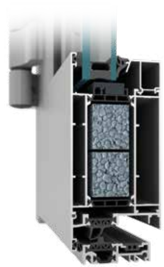
MB-79N SI, SI+

Beispiele für den Wärmedurchgangskoeffizienten U_D