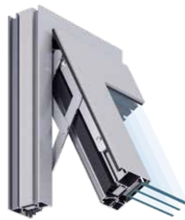
MB-79N CASEMENT SI

Beispiele für den Wärmedurchgangskoeffizienten U_w