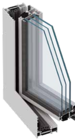
MB-79N US SI